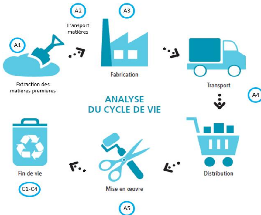
Diagramme du cycle de vie du produit :